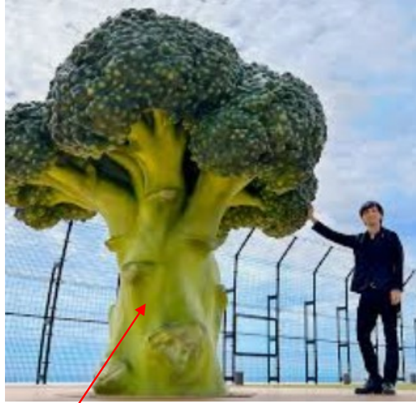
対象物のスケールを変える