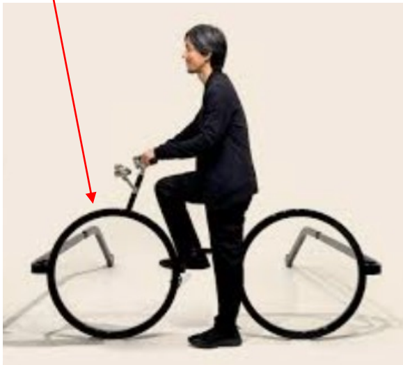
メガネフレームが自転車