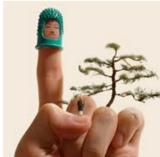
日本一ありがたい指サック