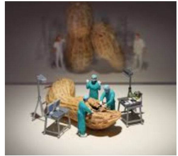
ケガしたのは落下したせい