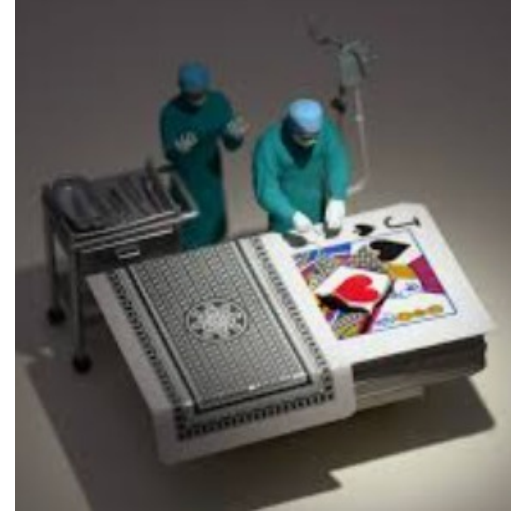
手術を受けるブラックジャック