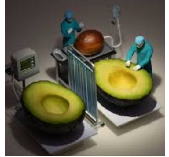
手術は成功よかつタネ