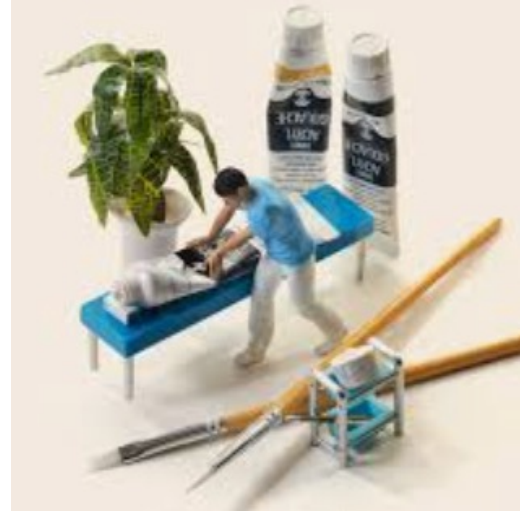
お客様の残った力を引き出します