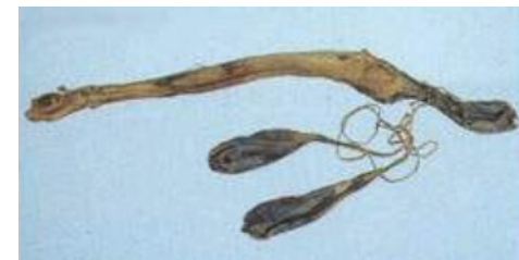
海狗腎(かいくじん)

家康は、8つの成分に滋養強壯を高める意図で海狗腎(かいくじん)を加え、薬棚の上から八番目の引き出しに入れて『八の字』と愛称で呼んでいた