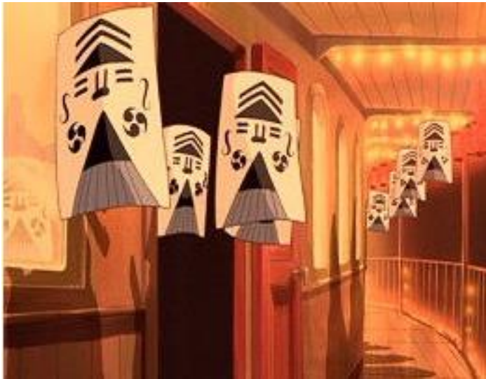
千と千尋の神隠しより